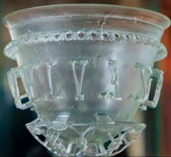
Vase diatrète