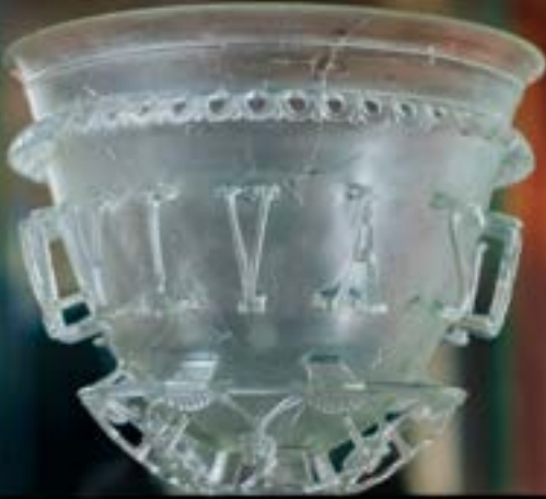
Vase diatrète

Durant tout le chantier, une sélection des chefs-d'œuvre du musée Rolin est présentée dans les salles d'expositions temporaires du Muséum. De l'Antiquité au XX e siècle, retrouvez les œuvres phares du musée dans une présentation intimiste et resserrée, qui rassemble le vase diatrète, Eve, la Nativité au cardinal Rolin, la Vierge d'Autun ou encore les peintures emblématiques du musée. En prime, c'est l'occasion d'en apprendre plus sur le vaste chantier du Panoptique et sur le projet final grâce à une évocation 3D.