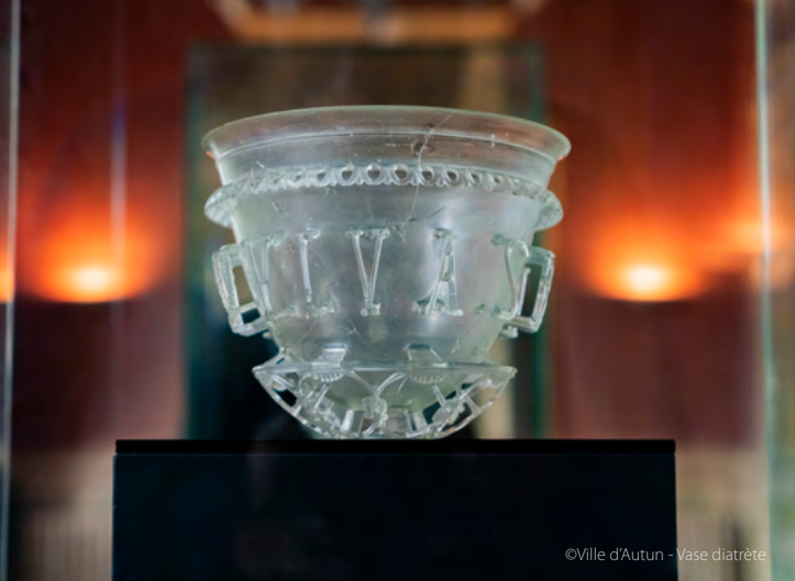
Vase diatrète